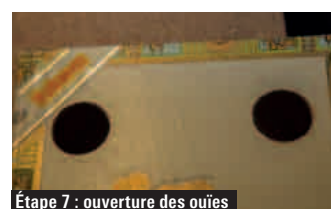
Étape 7 : ouverture des ouïes