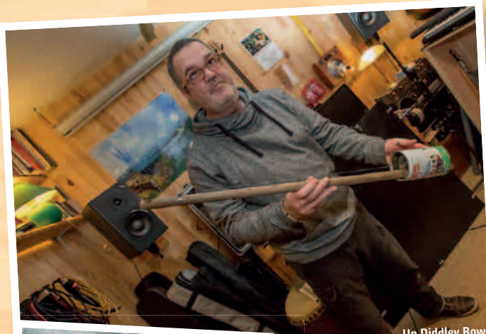
Un Diddley Bow

DB > En fait, cela dépend des modèles. Si tu prends, par exemple un Diddley Bow, c'est environ une heure de travail. Je viens d'ailleurs de faire une petite vidéo pédagogique sur YouTube pour expliquer la fabrication. Pour les guitars, cela dépend s'il y a des frettes ou pas et, bien entendu, du nombre de cordes. Si ce n'est pas