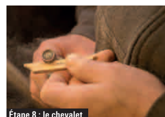
Étape 8 : le chevalet