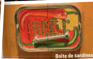
Boîte de sardines