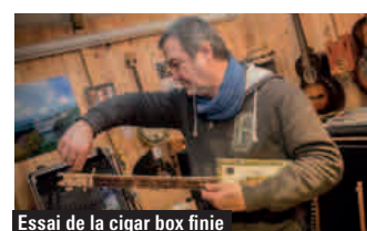
Essai de la cigar box finie