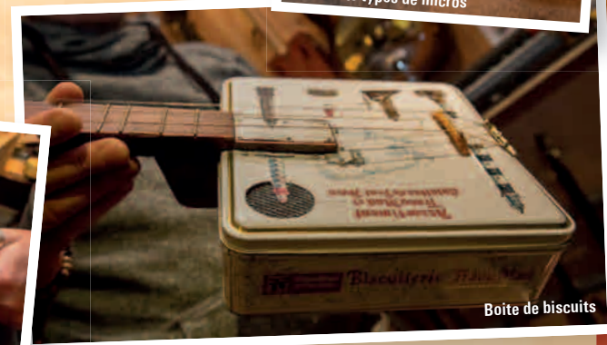
Boîte de biscuits