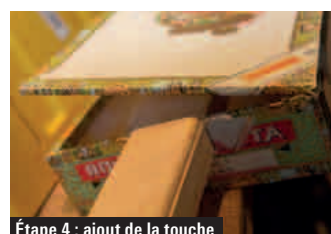
Étape 4 : ajout de la touche