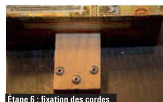
Étape 6 : fixation des cordes