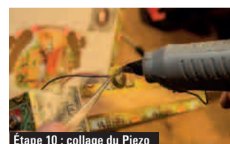
Étape 10 : collage du Piezo