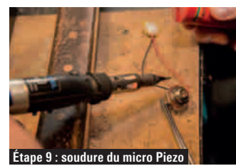
Étape 9 : soudure du micro Piezo