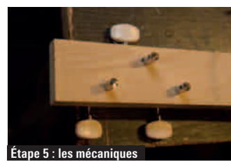
Étape 5 : les mécaniques