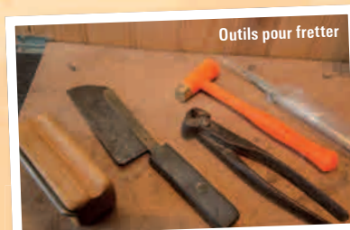
Outils pour fretter

DB > Majoritairement oui, mais il faut aussi essayer d'autres choses.