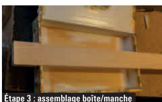
Étape 3 : assemblage boîte/manche