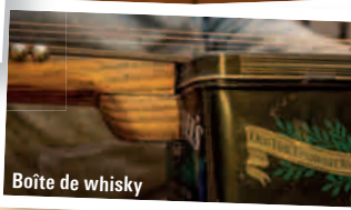
Boîte de whisky

fretté et que le manche n'est pas très droit, ça n'a pas d'importance, puisque ce sera joué au bottleneck. On va dire qu'en y apportant tout de même le soin nécessaire, on sera plus sur deux jours de travail, d'autant que je n'utilise pas de machines extraordinaires, et que je ne suis pas non plus le roi du bricolage.